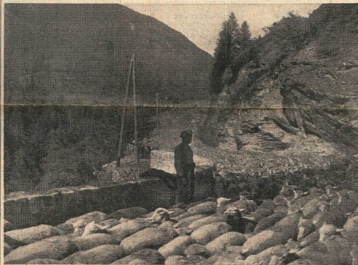
Dans ces solitudes montagnardes, les bergers, seuls avec leurs troupeaux...

CE SONT DES FOUS DU CRIME, DES FORCENÉS DE LA HAINE ET DE LA SOLITUDE