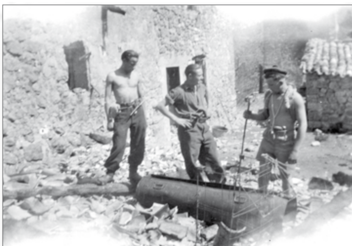
■ Le maquis Fort-de-France à la Haute-Melle

première étape de son infiltration. Papias et son acolyte Josset sont capturés en mars 1944 à Barrême par le maquis Fort-de-France alors qu'ils tentaient d'infiltrer une fois encore les maquis. Les menottes ont été prêtées par les gendarmes. Montés à la Haute-Melle, les deux Brandebourgeois sont interrogés et exécutés le 14 mars par un peloton de résistants. Durant leur détention, lors d'un parachutage de nuit, un conteneur a explosé en touchant le sol et le plus âgé, Josset, a cru alors à une attaque allemande.