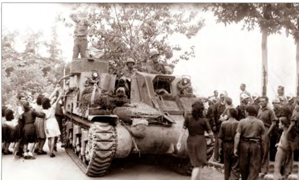
■ La libération de Digne, août 1944

Ses films ont été numérisés par les Archives départementales.